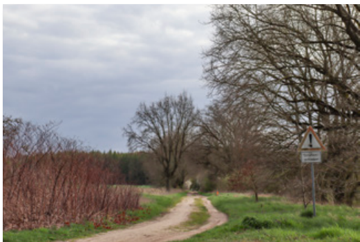
Weg zur Badestelle am Krewitzsee