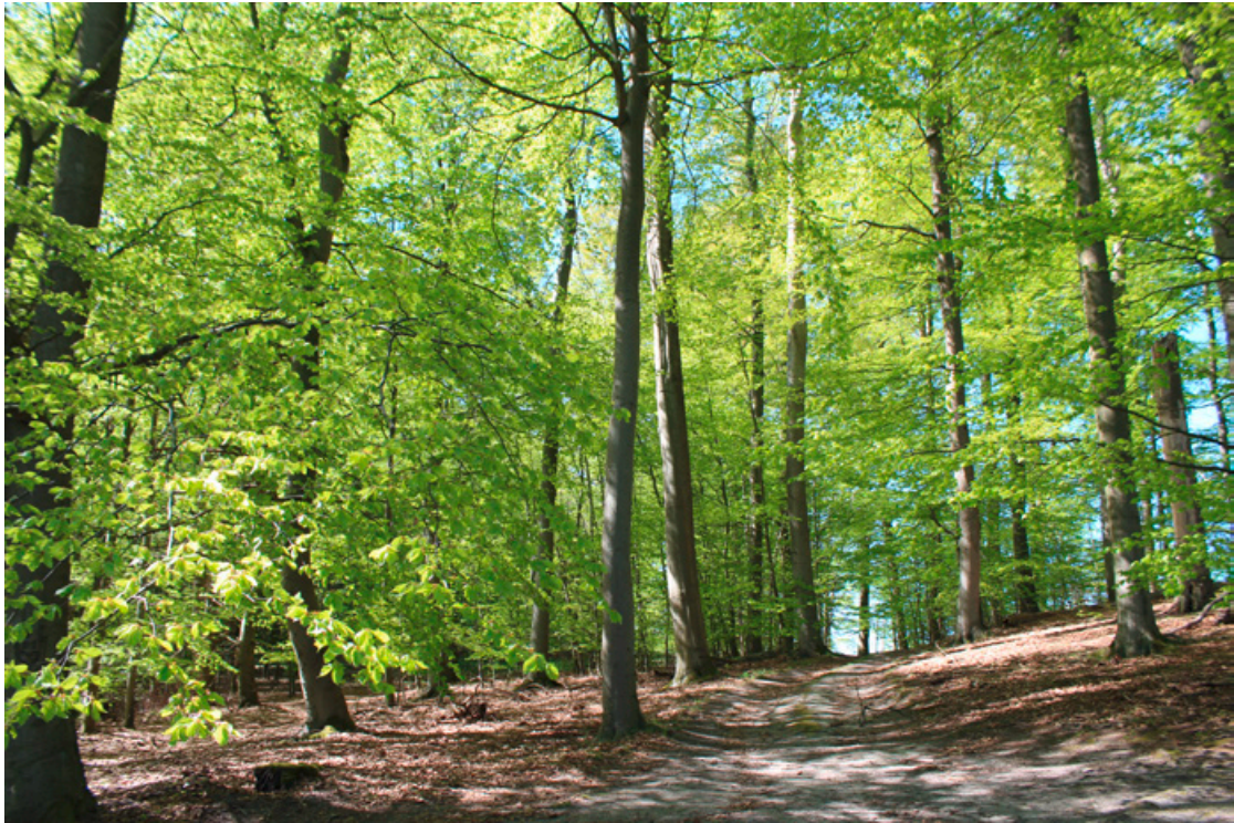
Frühling Zerweline Heide