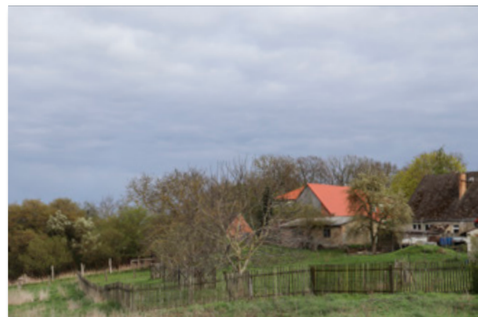
Blick von hinten zum Grundstück