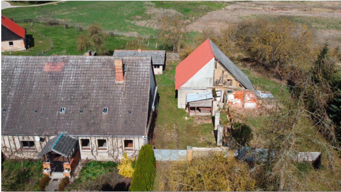
Grundstück von oben