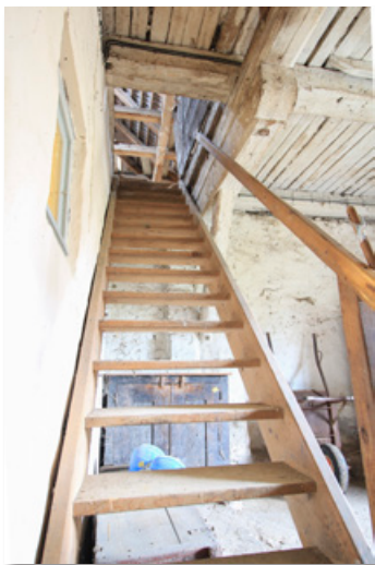
Treppe zum Dachboden