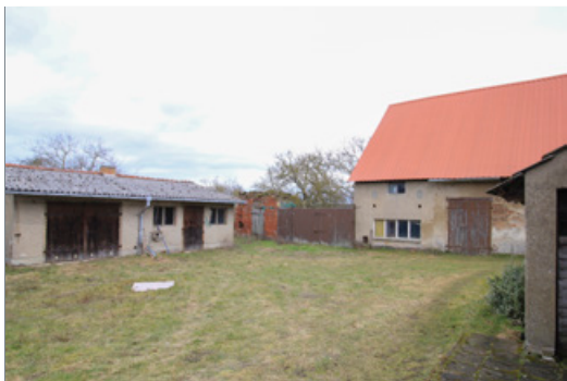
Blick vom Wohnhaus in den Hof