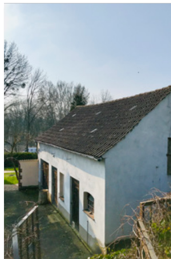
Blick vom oberen Garten zum Stall