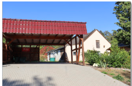
Carport mit Stallgebäude