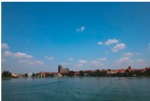
Blick auf Prenzlau vom See aus