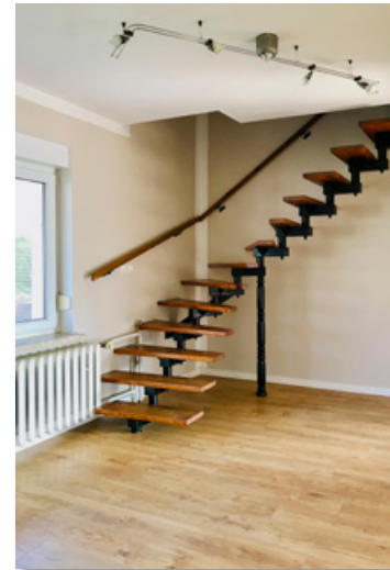
große Diele mit Treppe zum OG