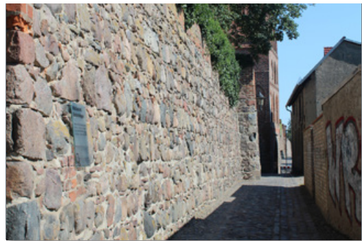
vollständig erhaltene Stadtmauer