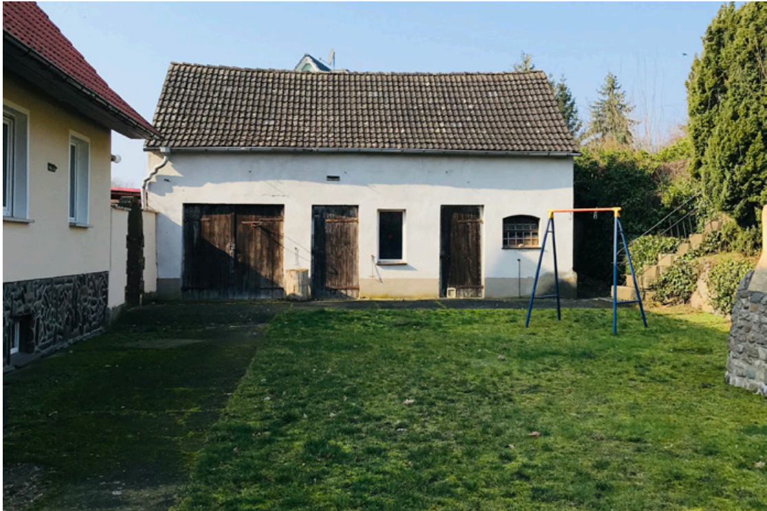
Blick zum Stall