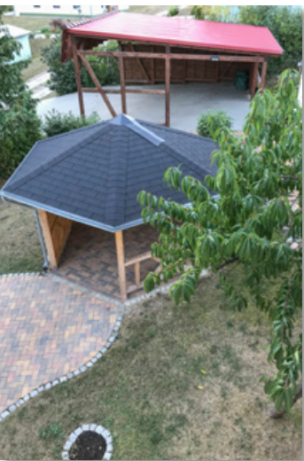
Laube und Carport