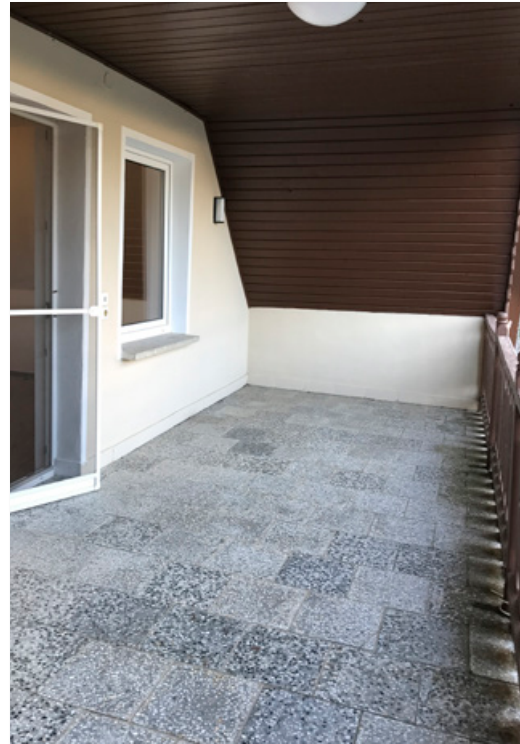
mit großem Balkon