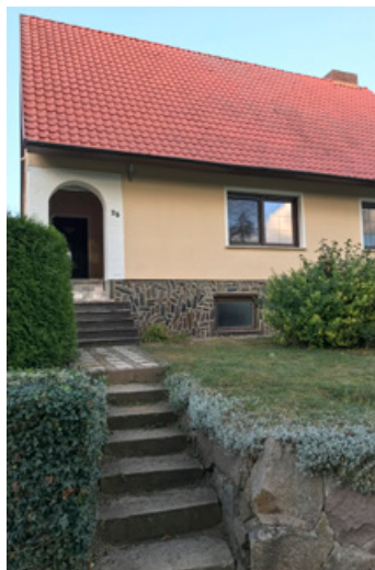
Straßenseite mit Hauseingang