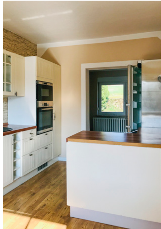
mit kompletter Einbauküche