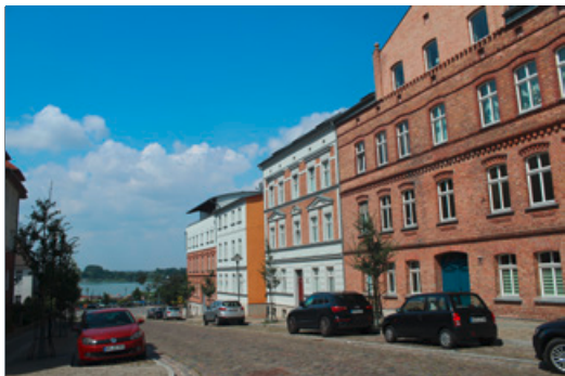
Historische Häuserfassaden in Prenzlau

Templin und Prenzlau sind beide gut erreichbar und bieten alles, was man zum Leben braucht: