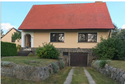
Straßenseite mit Garageneinfahrt