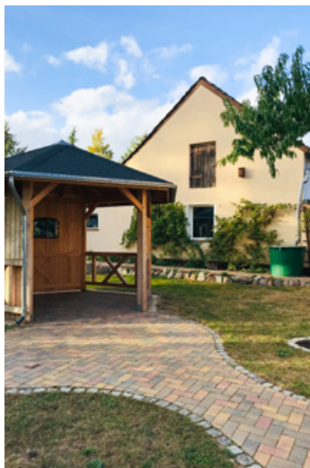
Laube und Stall