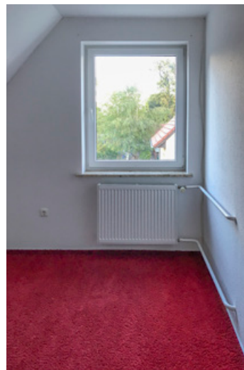
weiteres Schlafzimmer 1