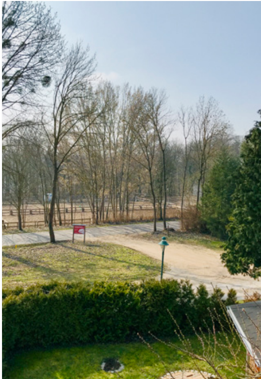
Ausblick zur Straße