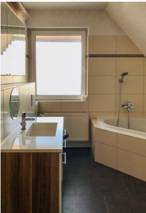
Bad mit Eckbadewanne