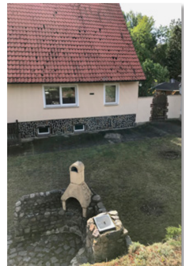
Blick vom oberen Garten zum Wohnhaus